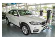
BMW X6 xDrive30d | 63.990 EUR

EZ 07/2014, 6.225 km, Diesel, 190 kW (258 PS), Automatik, Schwarzmetallic, Leder Schw., Xenon, PDC, Regensensor, LED-NS, Navi Pro, Standheizung, Sport-Multifunkt.-Lenkrad, HiFi, Komfortsitze, Sitzheizung, Klimaautom., Head-Up Display, Rückfahrkamera, Komforttelefonie, Dachreling, Anhängerkupplung, 18" LM-Räder