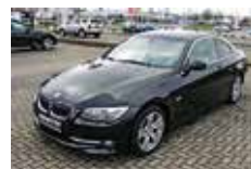
BMW 325d Coupe | 21.900 EUR

EZ 03/2009, 88.510 km, 105 kW (143 PS), Blaumetallic, Ablagenpaket, Comfort Paket, Auto Start/Stop Funktion, Brake Energy, Regeneration, Regensensor, Durchladesystem, Sitzheizung, Klimaautomatik, PDC, BC, Anhängerkupplung, Bereifung mit Notlaufeigenschaften, Servotronic, Radio BMW Professional