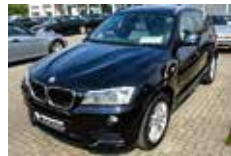
BMW X3 xDrive 20d | 32.840 EUR

EZ 06/2010, 136.420 km, Diesel, 150 kW (204 PS), Automatik, Havana Metallic, Leder beige, Xenon, Scheinwerfer-Waschanlage, Komfortsitze, el. Sitzverstellung, Sitzheizung, Edelholzausführung, Klimaautomatik, Sport-Lederlenkrad, el. Glasdach, PDC, CD-Player MP3-fähig, Bereifung mit Notlaufeig. LM-Räder V-Speiche